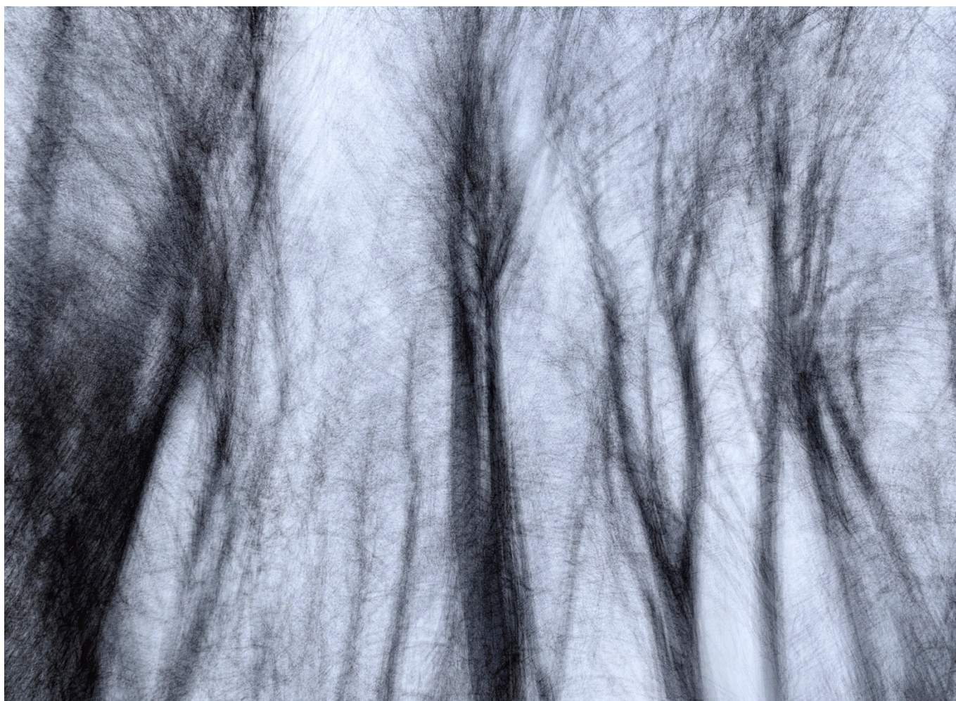
© Davies Zambotti, Racconti del fiume

Chissà a quali divinità incolpevoli Karen levava le sue preghiere, quando per lunghi mesi veniva costretta a letto dalla febbre, dalla depressione, dalla fatica di dovere sostenere una vita incandescente, segnata da momenti di grande euforia e poi di abissale prostrazione. Forse erano le divinità norrene delle sue fiabe che, alla fine dei tempi, stanche di inventare mondi, si sarebbero ritrovate a banchettare sulle sterminate pianure di un mondo nuovo: pianure abbacinate da una luce insostenibile. Per la scrittrice, il 7 aprile 1918 è un giorno uscito dalla risata di un dio 7 . Ci sono diverse foto che ritraggono Denys Hatton Finch, eppure non riesco a immaginarmelo se non animato da una certa gestualità, dentro un modo di camminare che esprime la soddisfazione di essere un uomo libero. In Karen c'è una linea esatta che lo contiene e inizia nella parte destra della tempia e da lì scende, parallela alla spina dorsale, fino ad affossarsi nel bacino. Questa linea è